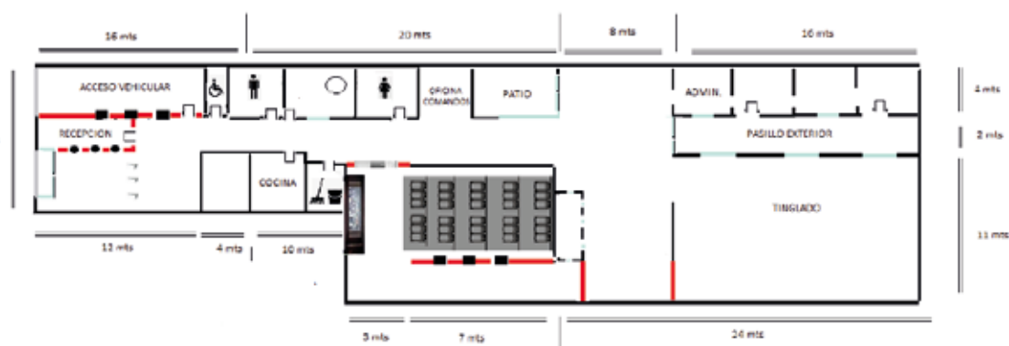
Plano de planta :