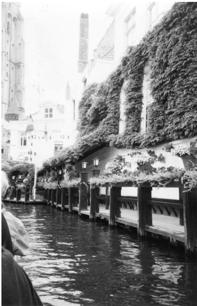
Paseando por los limpios canales que atraviesan la ciudad en todas sus direcciones