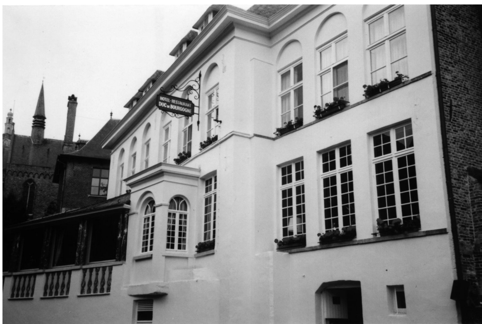
Rodeada de ventanas floridas que iluminan las paredes blancas y los techos de pizarra a dos aguas